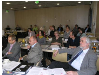
Blick ins VV-Plenum

soziale Situation nach der Approbation genauer zu kennen, führte die LPK-BW in Abstimmung mit anderen Landeskammern eine Umfrage unter den in den letzten zwei Jahren approbierten PsychotherapeutInnen durch. Neben soziodemographischen Daten wurden Fragen zur absolvierten Ausbildung, zur Berufstätigkeit vor und nach der Approbation und zur Zufriedenheit mit der Ausbildung und der aktuellen Situation erhoben. Über die Ergebnisse werden wir Sie demnächst unterrichten.